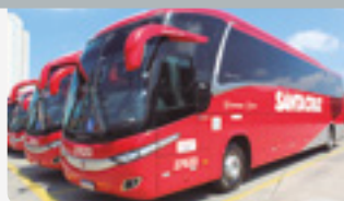
Ano de 2016