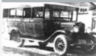
Ano de 1952