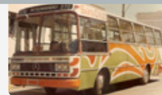
Década de 1960