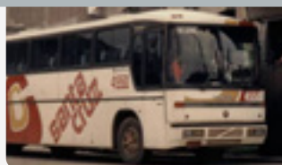
Década de 1980