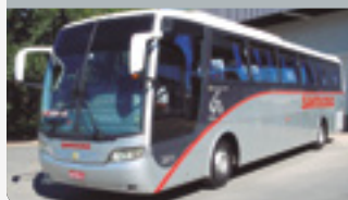
Década de 2000