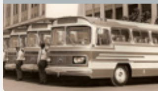
Década de 1970