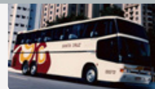
Década de 1990