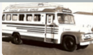
Ano de 1958